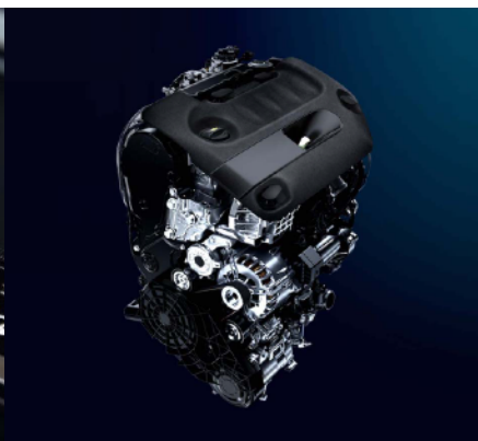
DW10型クリーンディーゼルエンジン