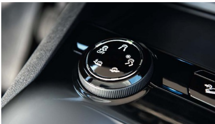
アドバンスドグリップコントロール