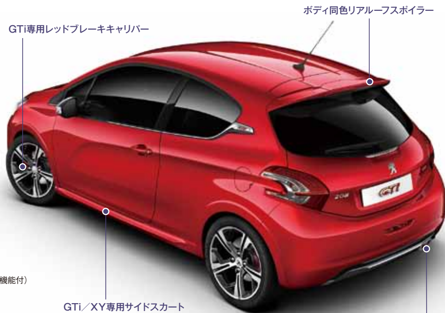
GTi/XY専用サイドスカート