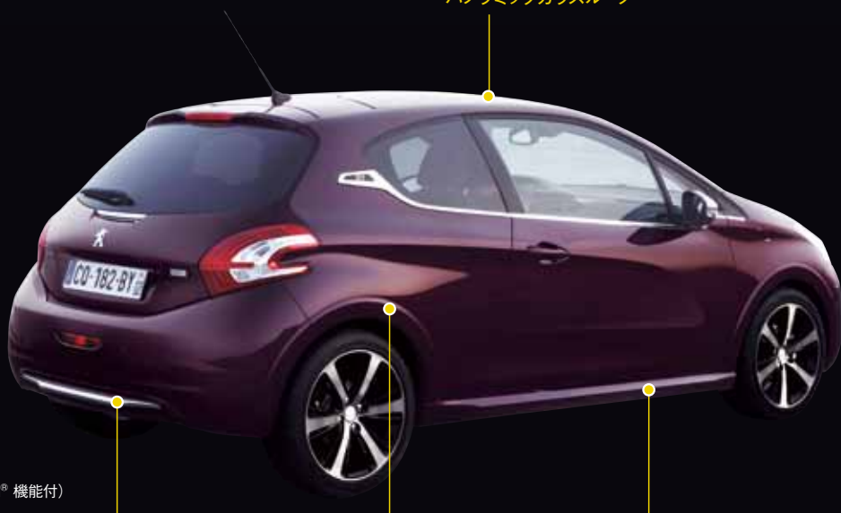
XY専用リアバンパー