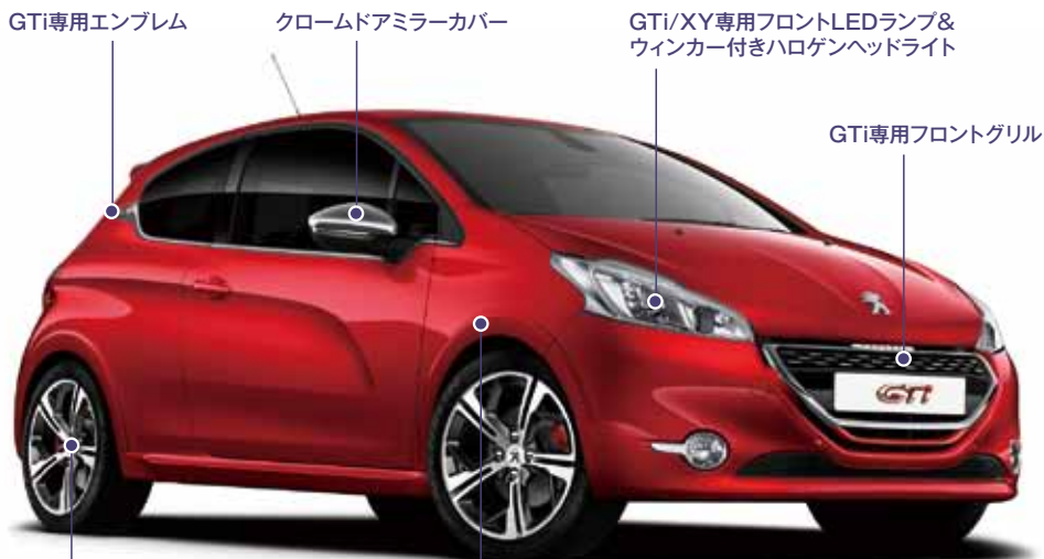
GTi専用17インチアロイホイール

17インチアロイホイール[Carbone ダークグレー] GTi専用スポーツサスペンション レッドブレーキキャリパー